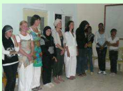
Come Together Party