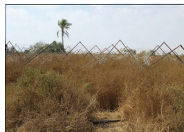
Im Mai 2007

Seit tausenden von Jahren wird hier auf natürliche Weise angebaut. Unsere Ernten sollen dereinst das Social und FairTrade Zertifikat erhalten. Darauf arbeiten wir hin.