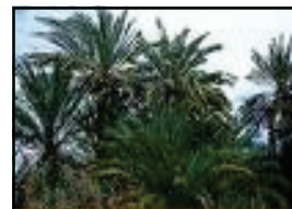
Im Mai 2009?